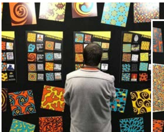
FIJ, Cannes 2018

C'est d'ailleurs parce qu'il se prête bien à cet exercice que le jeu a été décliné dans une version spéciale « Jeux de société » en 2019, puis dans une version « Japan » en 2021.