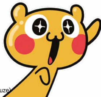
La pub japonaise (réalisée par Fabien Bleuze)