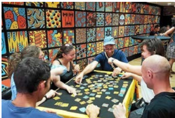
Le Repaire, Parthenay 2019

C'est d'abord le design très épuré et coloré qui fait le succès de la formule, mais il ne faut pas oublier que Twin it ! regorge de références cachées et que les retrouver procure un plaisir universel !