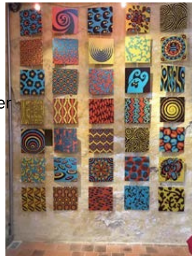
Médiathèque Lacanau 2018

C'est d'ailleurs parce qu'il se prête bien à cet exercice que le jeu a été décliné dans une version spéciale « Jeux de société » en 2019, puis dans une version « Japan » en 2021.